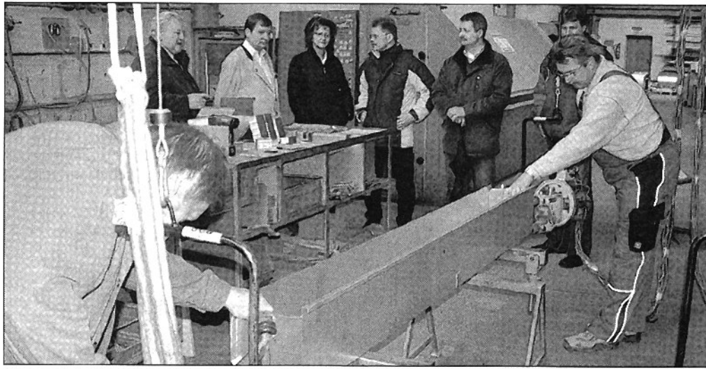
Ein Teil der Eröffnungsgäste konnte bei einer Demonstration verfolgen, wie viele Handgriffe nötig sind, um einen Rollokasten herzustellen.