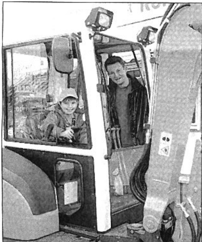
Früh übt sich, wer einmal ein Baggerfahrer werden will.

Zwar regnete es am Samstag zum Teil in Strömen, was sich auf die Zahl der Besucher auswirkte. Am Sonntag schließlich scheint jedoch die Sonne und so herrschte auf dem Messengelände stellenweise dichtes Gedränge. Viele Gäste nutzten das Angebot zur Beratung aus erster Hand. „Wir sind vollauf zufrieden, die Leute gingen ganz konkret auf uns zu und suchten das Gespräch“, erklärte einer der Aussteller.